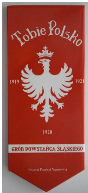
Znak pamięci Tobie Polsko

Podsumowanie akcji „Powstańcy to wiara, nadzieja i cud”. Ocalmy groby powstańców śląskich od zapomnienia! (2019-2021)